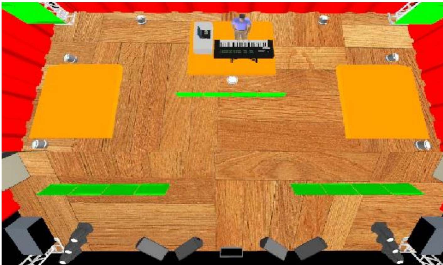
LUZ DE CHÃO