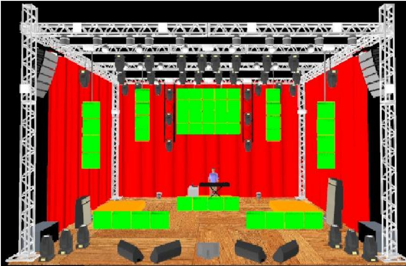
MONTAGEM DOS LEDS